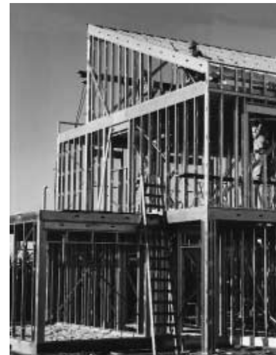
De Starframe-woning wordt door- gerekend met Ecoquantum.