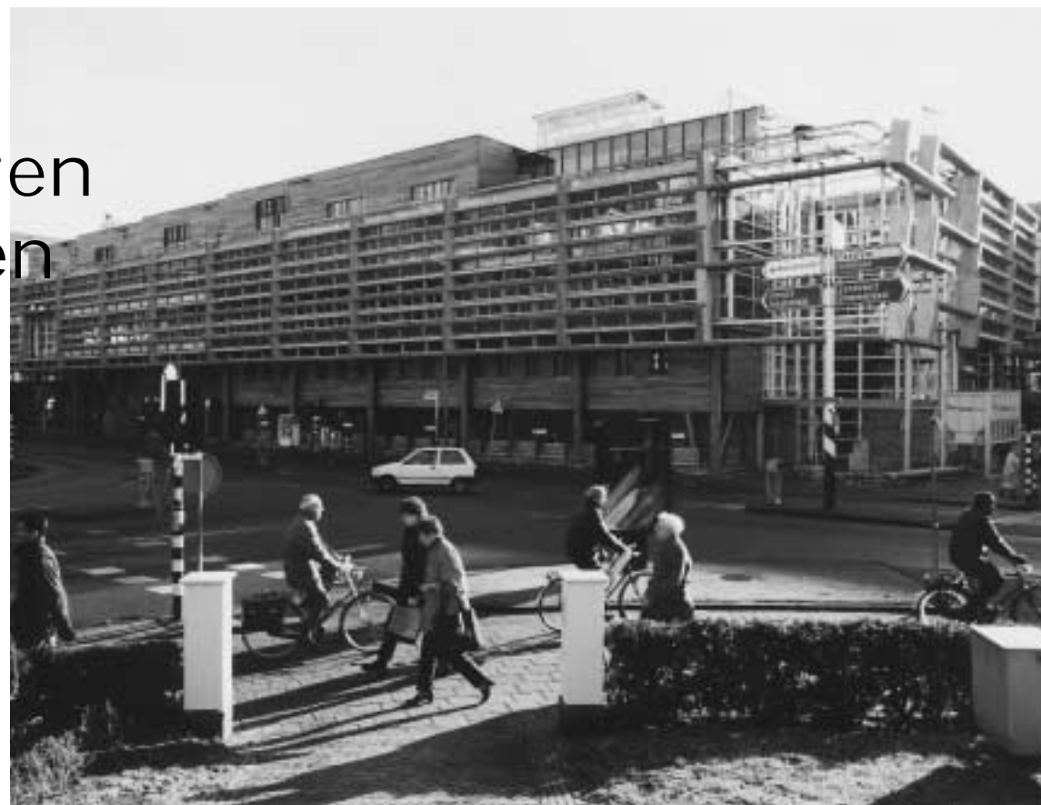
Kantoorgebouw Kennemerplein: een voorbeeld van een duurzaam ontworpen gebouw.