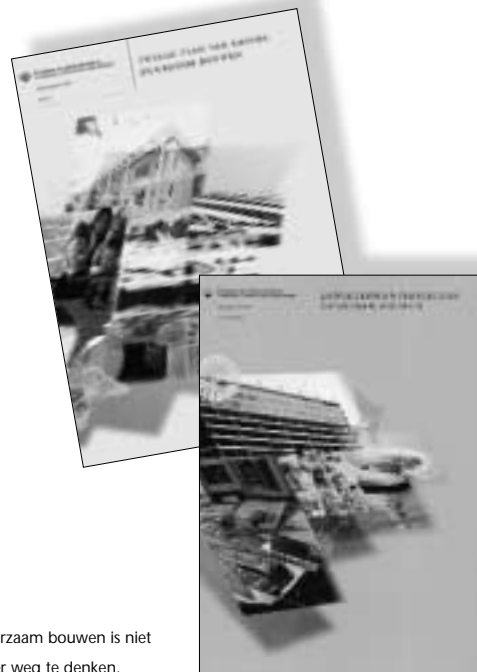
Duurzaam bouwen is niet meer weg te denken.

Een 'groen' imago heeft staal nog niet echt. Dat oordeel kan echter nauwelijks zijn gebaseerd op objectieve gegevens, want die waren tot dusver maar mondjesmaat bekend. De staalbranche is nu begonnen daar verandering in te brengen. Op verschillende fronten wordt gewerkt aan het meten en bekend maken van de milieuprestaties van stalen bouwproducten. Een overzicht van de stand van zaken.